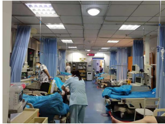
二期规培学员急诊科下半夜值班