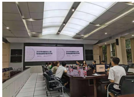
二期规培学员参加第一届学员答辩