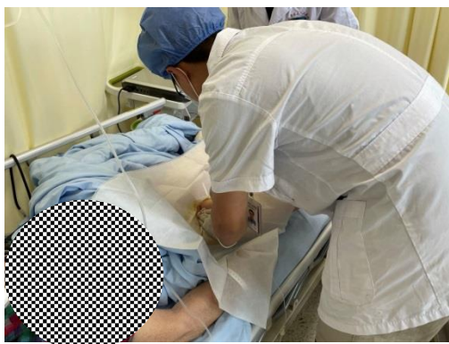
二期规培学员观摩股静脉置管