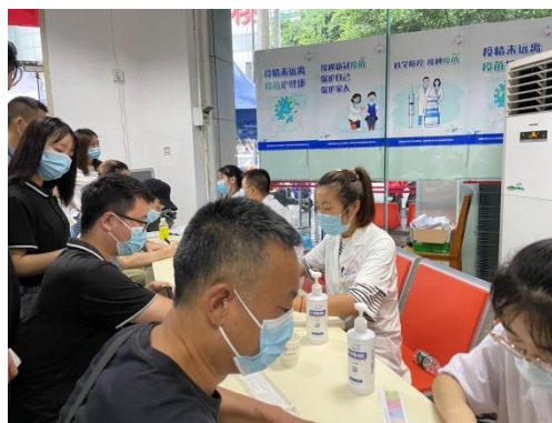
二期规培学员参与疫苗接种