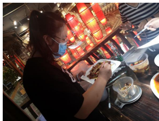
二期规培学员参加食品采样