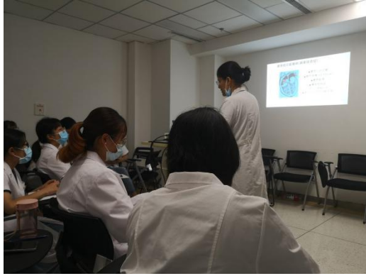
二期规培学员参加小讲课