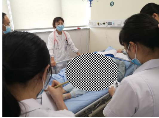
二期规培学员参加教学查房