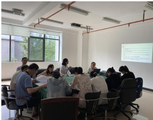
二期规培学员参加科室学习

我第一个轮转的科室是慢病所，在所长以及两位副所长的带领下，我参与了老年人健康素养项目，协助老师完成相关问卷及校稿，让我从不同层面了解了慢病工作。区县疾控慢病工作主要是收集数据、完成相应的工作，而省疾控则站在如何将收