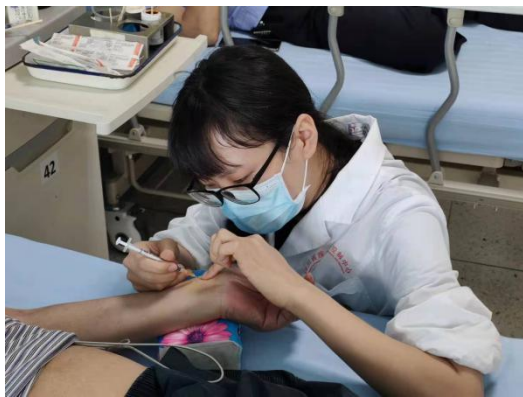
二期规培学员采集动脉血