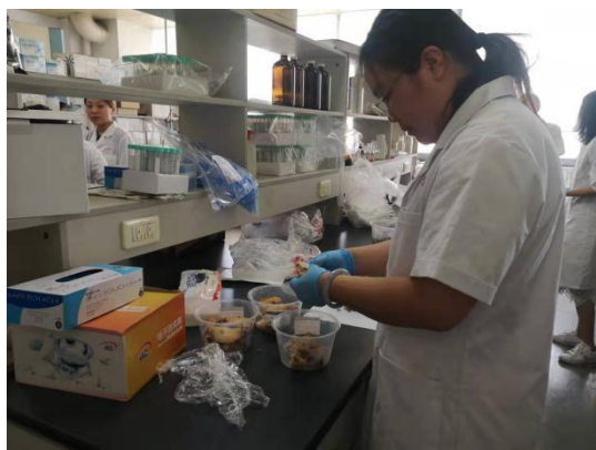
二期规培学员参加食品分装