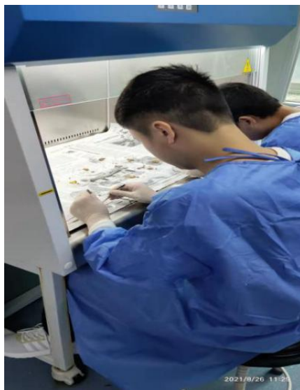
二期规培学员解剖福寿螺的肺囊

结束了临床规培学习后，8月初在四川省疾病预防控制中心开始了为期一年的公共卫生阶段规培学习。我第一个轮转的科室是寄研所的线虫科，这个科室涵盖了钩虫、蛔虫、鞭虫、蛲虫等土源性线虫以及肝吸虫、广州管圆线虫等食源性寄生虫。期间，我参加了广州管圆线虫的现场监测，系统学习了该寄生虫的生活史、传