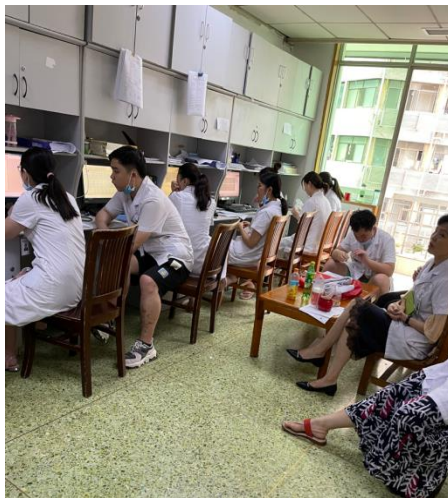
二期规培学员参加妇科病例讨论

在妇产科轮转期间，通过带教老师的小讲课及组内讨论学习，结合实际病例重点讲述了子宫破裂以及绝经后出血的病情，了解了妇科及产科常见疾病的诊断及治疗。同时，在带教老师的指导下，我学会了静脉采血、换药、拆线、红外线照射切口、更换引流袋等临床操作。同时学会了如何与病人进行沟通，以取得病人配合，顺利完成临床操作。