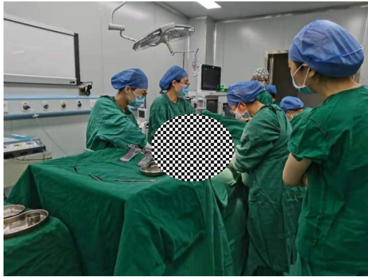
二期规培学员观摩剖宫产手术