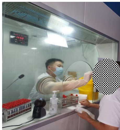
二期规培学员急诊科采核酸

急诊科轮转期间，我被分配到抢救室工作，在这里首先我学到的就是“时间就是生命”，这里的医护人员，每个人时时刻刻都保持着专注与冷静，准备迎接着前方不可预知的挑战，这种品质值得我们