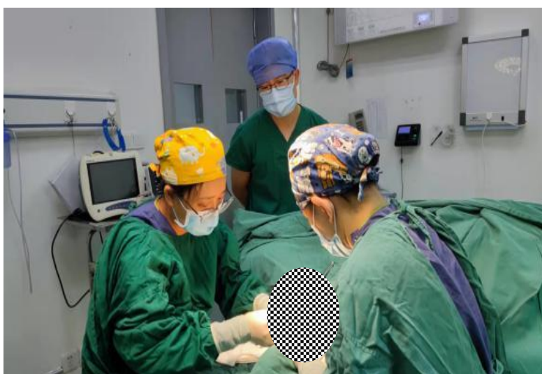
二期规培学员观摩动静脉瘘吻合手术